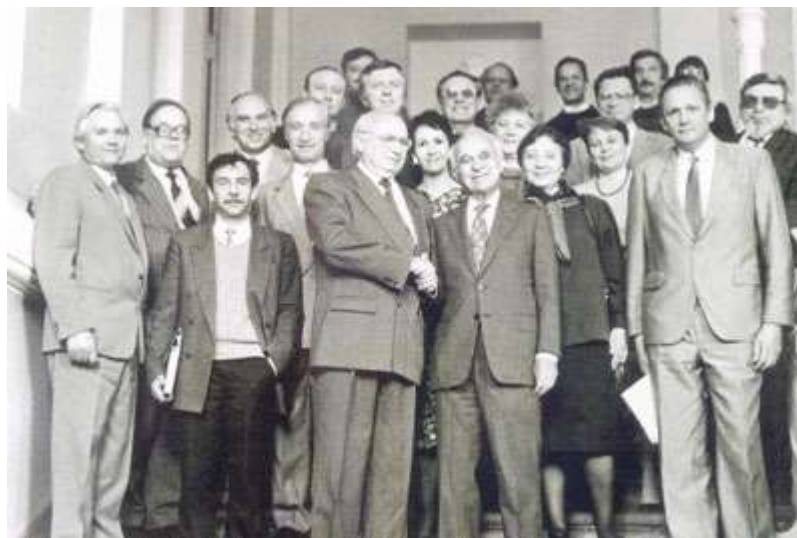
Почетный доктор СПбГУЭФ Лауреат Нобелевской премии В.Леонтьев с учеными университета

В 1980 г. ЛФЭИ им. Н.А.Вознесенского за большие заслуги в деле подготовки высококвалифицированных кадров и успехи в развитии экономической науки был награжден Орденом Трудового Красного Знамени.