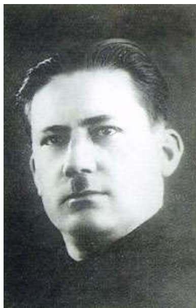
Ф.М. Малиновский, 1-й директор института

Санкт-Петербургский государственный университет экономики и финансов (СПБГУЭФ) ведет свою историю с конца XIX в., когда был основан Политехнический институт. В конце 20-х годов XX в. в связи с реконструкцией народного хозяйства руководством страны было принято решение «коренным образом улучшить дело подготовки экономистов как для промышленности, так и для торговых, финансовых, плановых и статистических органов; упорядочить систему и направление экономических вузов; придать соответствующим вузам, факультетам, отделениям более определенное целевое назначение в связи с потребностями народного хозяйства».