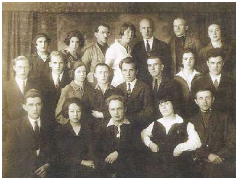
1-й курс ЛФЭИ 1930-1931 учебный год